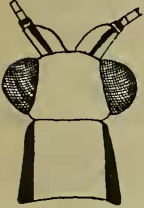
Chrysopa cornuta Nav. Kopf u. Prothorax.

Caput (fig. 1) facie viridi-flava, occipite flavo, linea elevata transversa a vertice distincto; oculus in sino nigris; palpis flavis; antennis ala anteriore multo longioribus, tenuibus, flavis; articulo primo viridi-flavo, stria dorsali rubro-fusca signato, secundo annulo rubro.